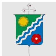
DIÓCESIS DE APARTADÓ