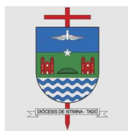
DIÓCESIS DE ISTMINA