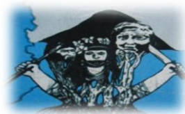
MESA DEPARTAMENTAL INDÍGENA